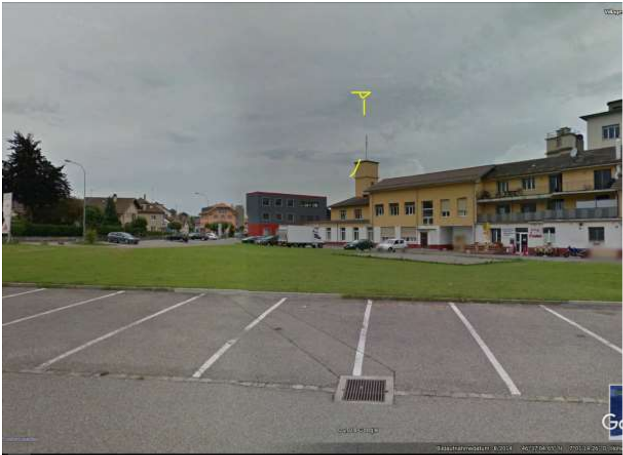
Wetter in Baar war trocken: 638_Baar_04.10.16