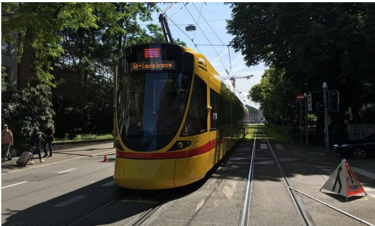
Am Freitagnachmittag kollidierte ein älterer Velofahrer mit einem Tram.

Basel Aeschengraben 6.2016, keine Polizeimeldung