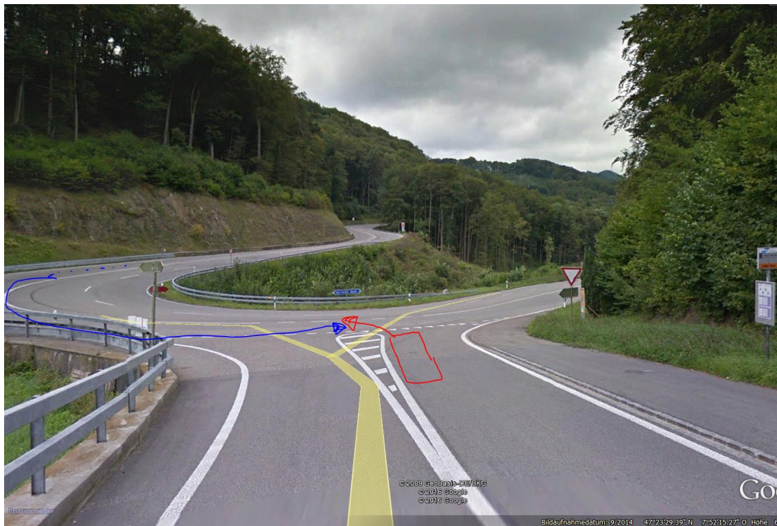
Herfahrtstrecke von Wiesen: kein Funk, übersichtlich. Mittag 22.5. sehr hell, föhnig-warm