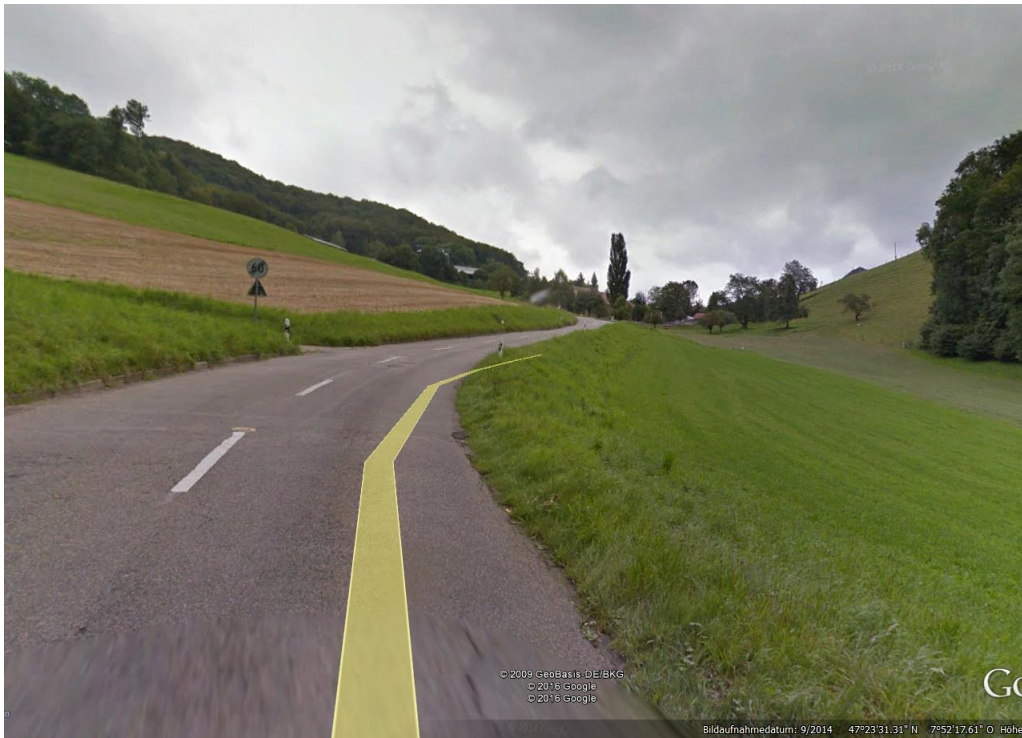
Herfahrtstrecke, ohne Funk