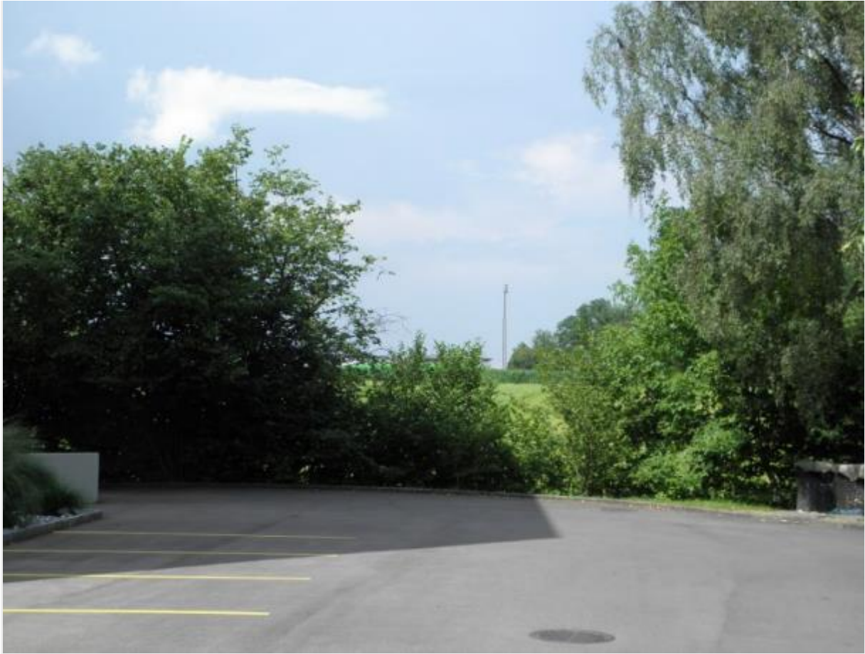
Parkplatz nach Haus 13 und vor Haus 15, Sicht Sender frei.