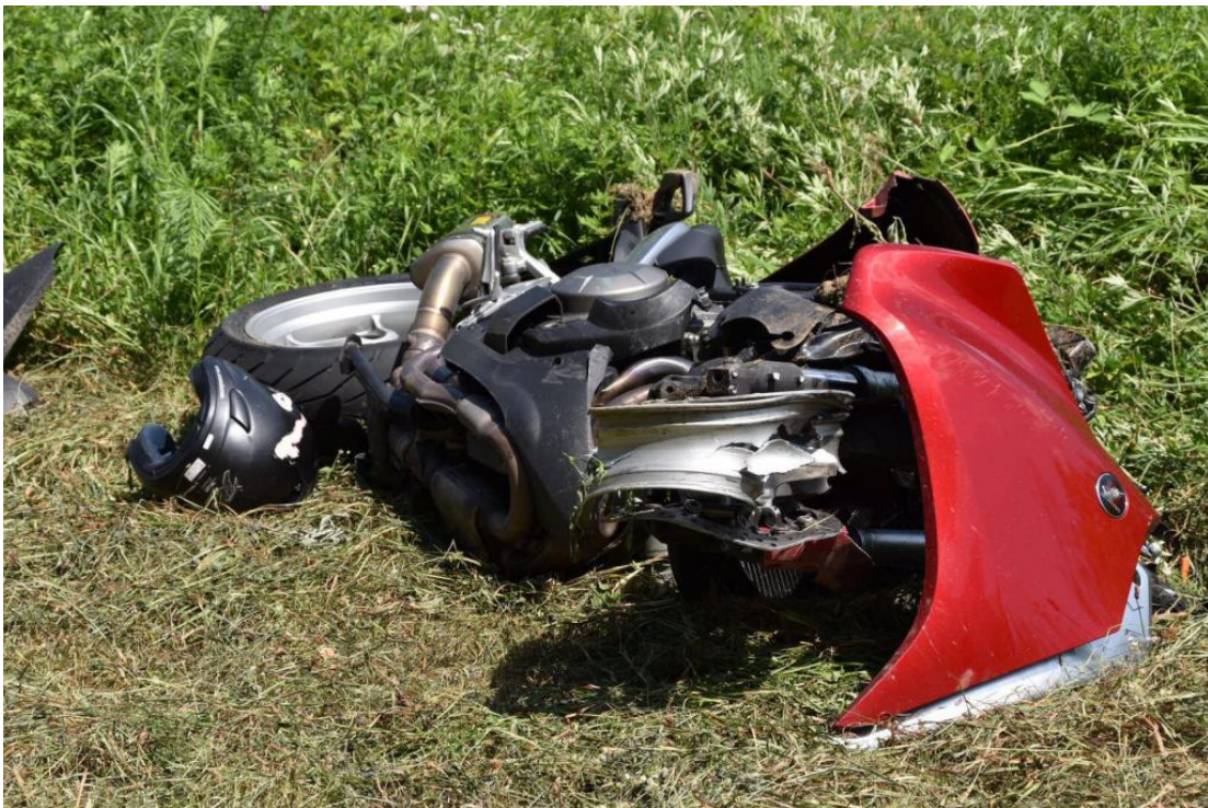
Extreme Wucht hat das Auto um 180 Grad drehen lassen. Motorrad vermutlich sehr schnell.