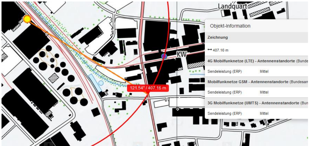
Sender auf Silo Landi, Fall 1308