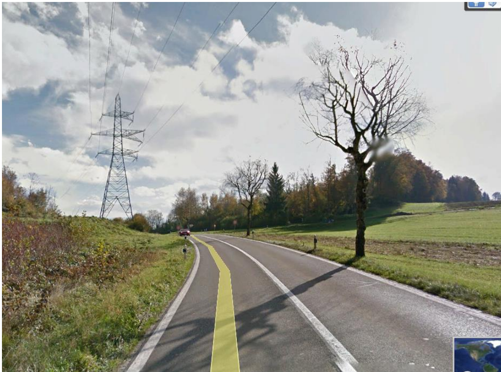
Der Lieferwagen-Fahrer musste vorher unter dieser Hochspannungsleitung passieren