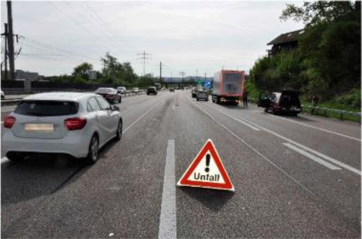
Verspäteter Entscheid, Ausfahrt zu benützen.