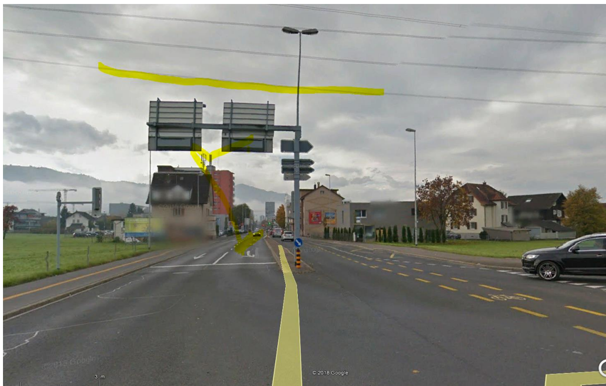
Reflexionen am rechten Signalen über der Fahrbahn, somit auch frontal