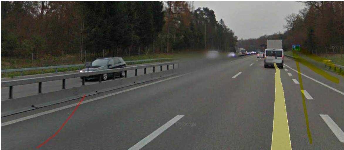
Am Parkplatz-Ausstellungsschild entsteht Reflexion, führt kurzfristig zu beidseitiger Exposition.