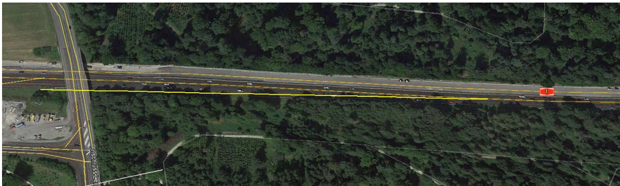
Das Schild kann im Zusammenhang mit den Bauarbeiten installiert worden sein, fehlende Bilder lassen keine Rekonstruktion zu.