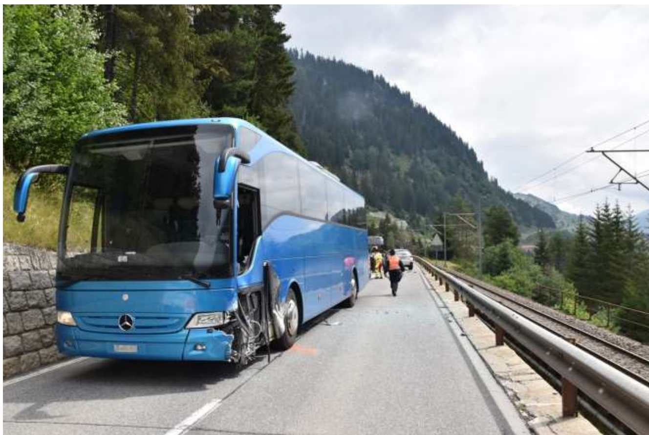
Bus hat Sicherheitslinie um 10-20cm überfahren.

Ein 49-jähriger Lenker eines Reisebusses ohne Fahrgäste fuhr am Montag um 10.40 Uhr auf der Oberalpstrasse H19 von Sumvitg in Richtung Disentis/Mustér. Gleichzeitig fuhr ein 58-jähriger Autolenker in die Gegenrichtung. Auf einem geraden Strassenabschnitt oberhalb Punt Russein kam es zu einer seitlich-frontalen Kollision der beiden Fahrzeuge. Der Autolenker wurde dabei leicht verletzt und nach der Erstversorgung durch ein Ambulanzteam ins Spital nach Ilanz transportiert. Das total beschädigte Auto musste aufgeladen und abtransportiert werden. Die Kantonspolizei Graubünden untersucht den Unfallhergang.