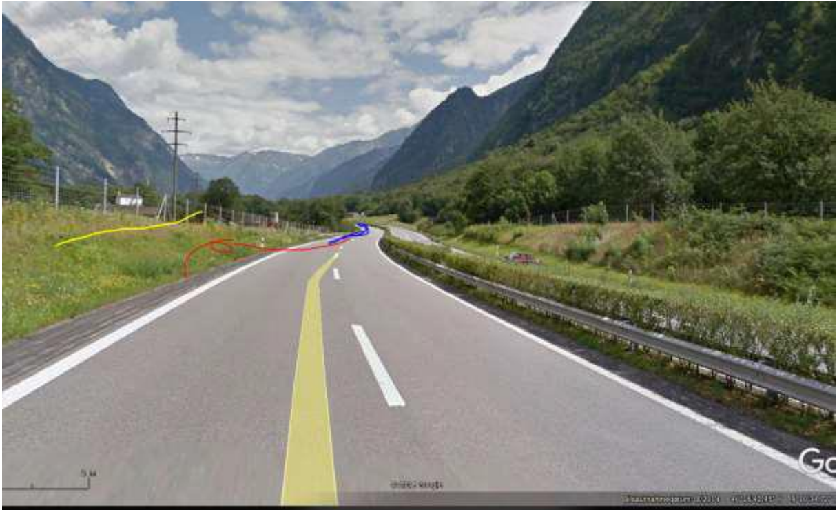
Kurve mit vergleichsweise starker Annäherung von rechts, Ebene 5 Hochspannungsleitung.