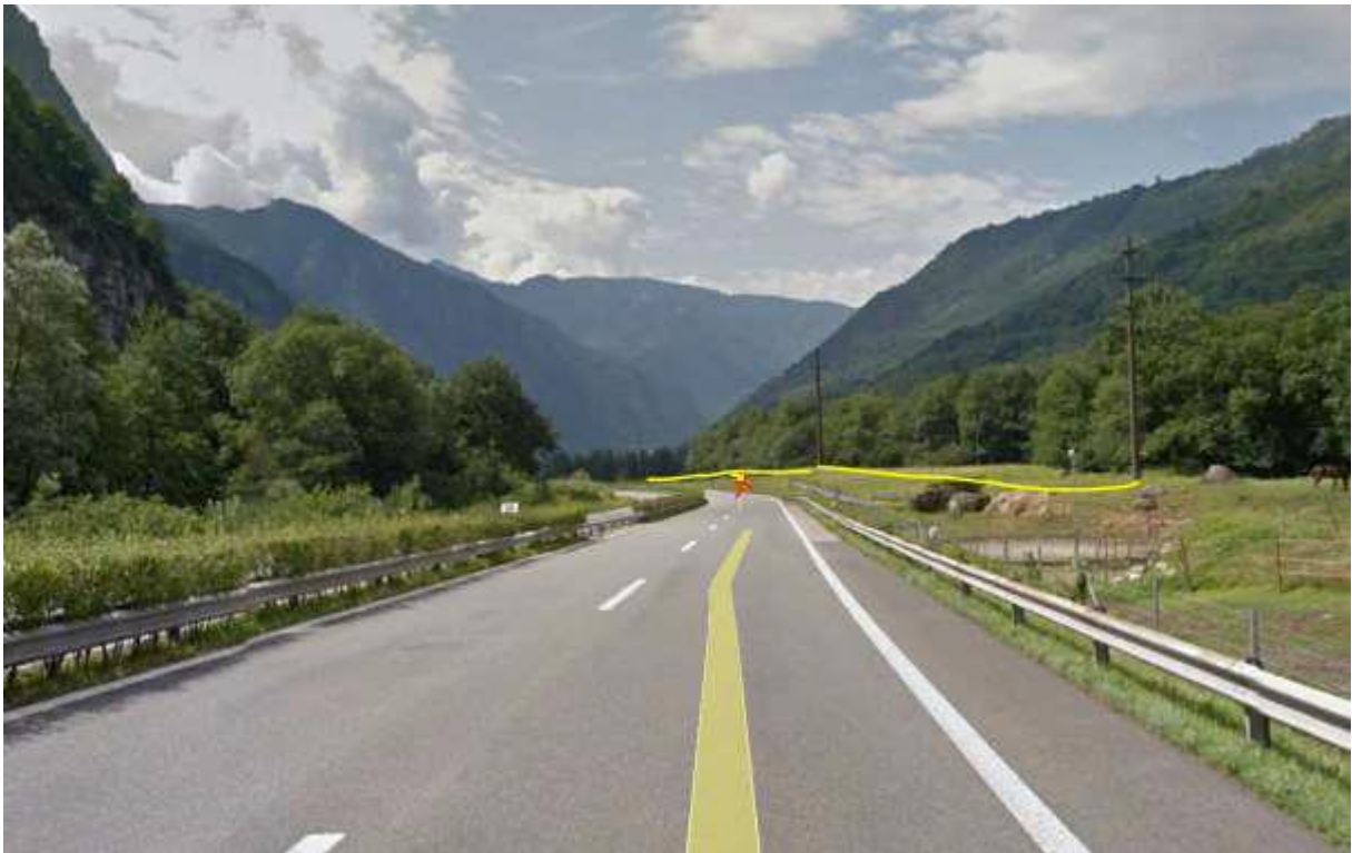
Rechts kommt in flachem Winkel HS Ebene 5 dazu