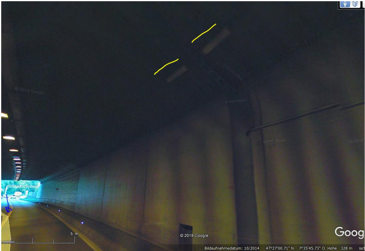
Kontrollgruppe BL Verlauf 5-6_2008