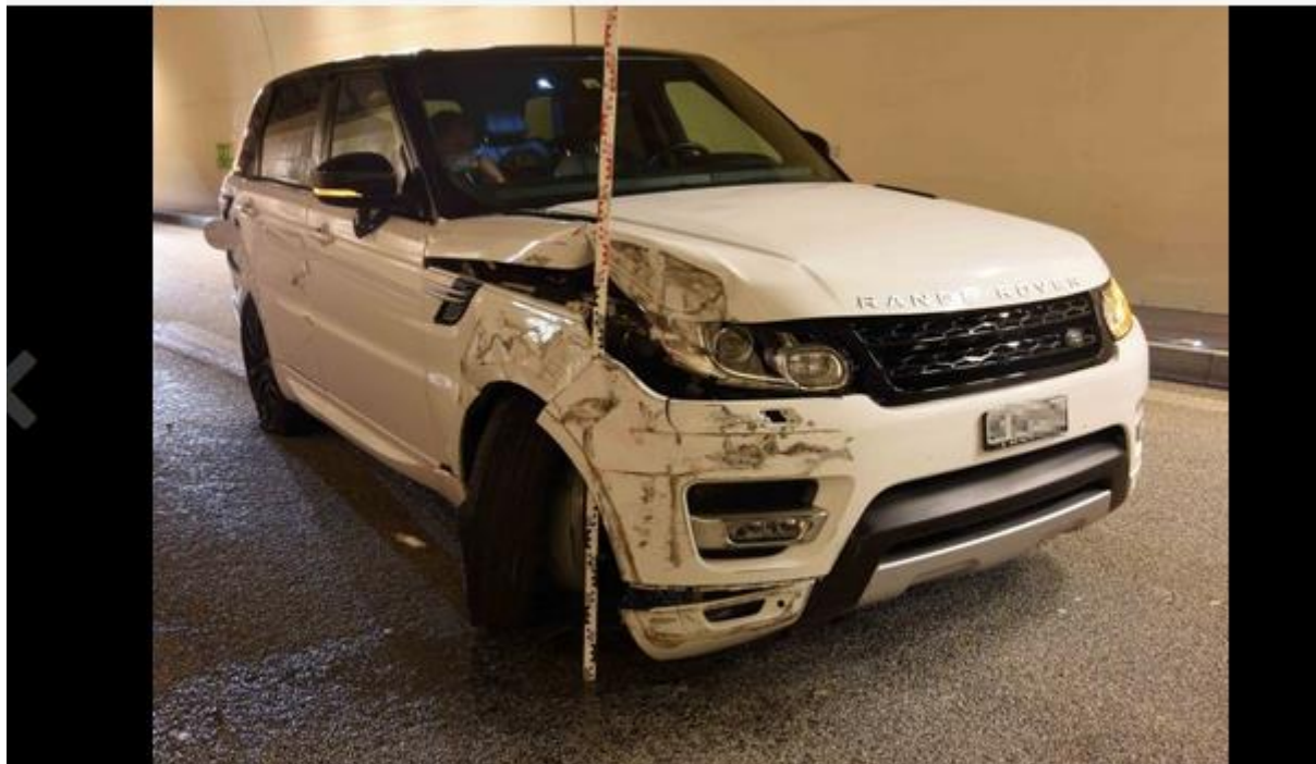
ergiswil: Zwei Unfälle im Kirchenwaldtunnel