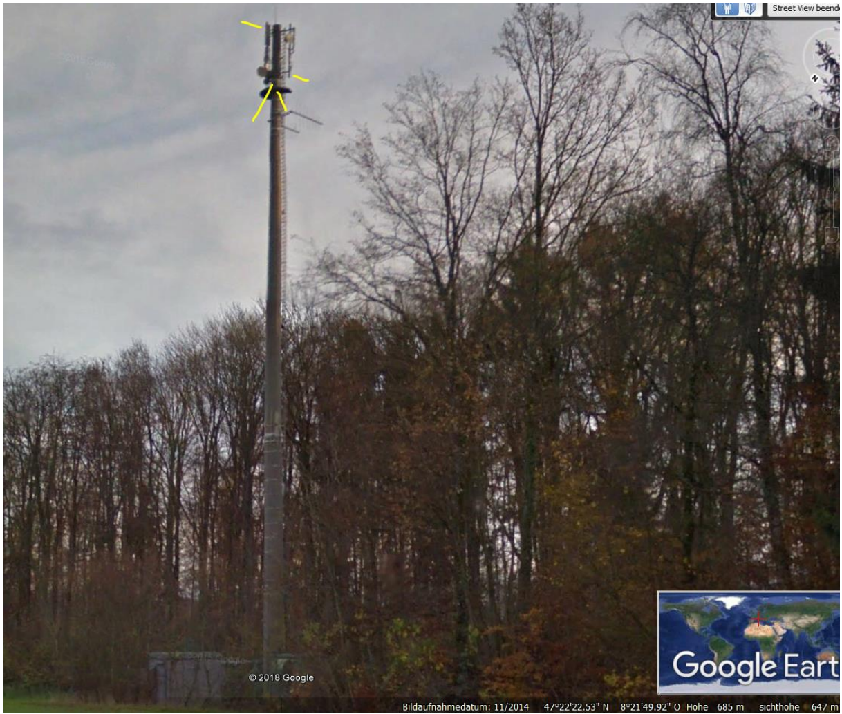
Der Sender parallel zum Waldsaum geht Richtung WNW