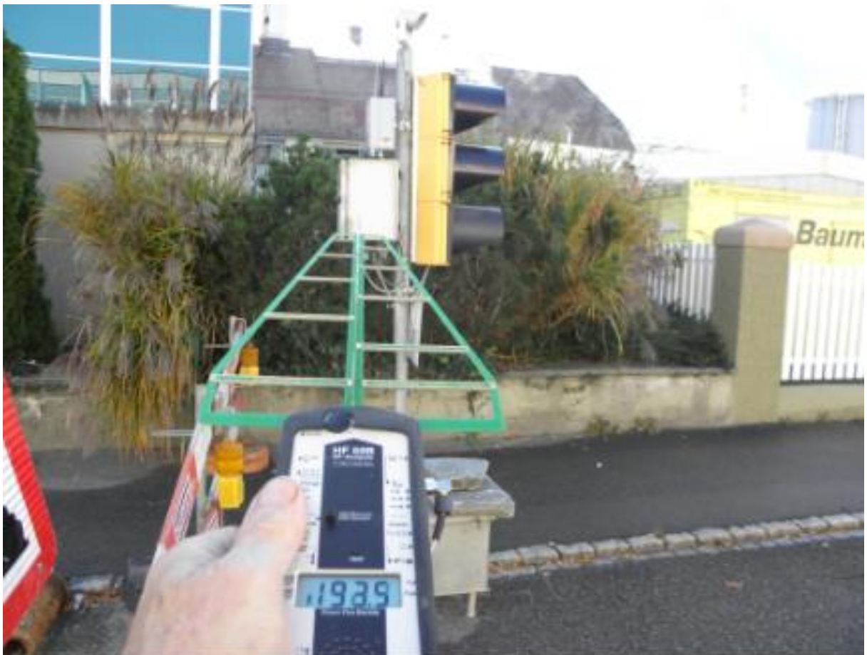
mobile / temporäre Verkehrsregelungsanlage der Signaltechnik Walter AG, Sulgen