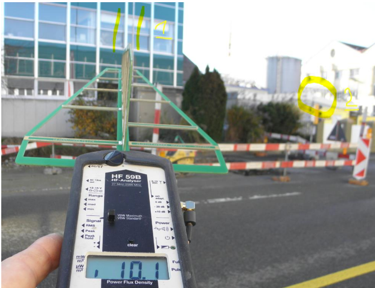
Höhe Unfallstelle eine mobile Signalanlage