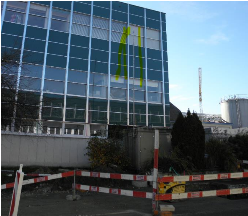
Kurz vor der Unfallstelle