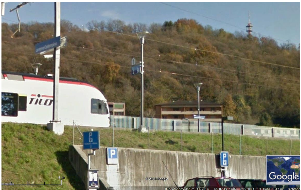
Sender mit wahrscheinlicher Senderichtung NW, Verkehrsachsen und Lamone