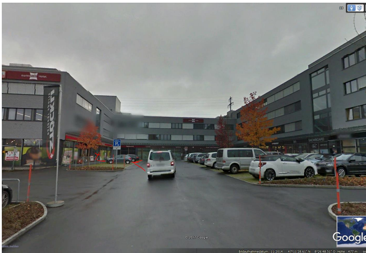
Farblich und vom Modell her könnte das auch das Unfallauto sein...Renault