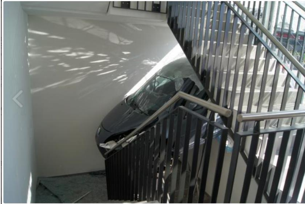
Lenkeinstellung gerade. Vermutlich P vor dem Haus.