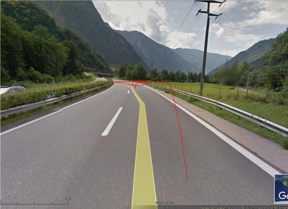
Herfährt mit in 20-30°-Winkel heranführender Hochspannungsleitung