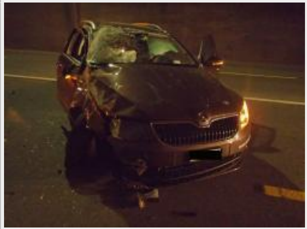
Baden, Baldingen AG - Selbstunfälle mit hohem Sachschaden

Baden: Sekundenschlaf eines Autofahrers Am Samstag, 3. Oktober 2015, kurz vor 5 Uhr, fuhr ein Automobilist auf der Neuenhoferstrasse in Richtung Baden. Dabei verlor er die Herrschaft über den Skoda und kollidierte bei einer Bahnunterführung mit der Stützmauer. Daraufhin überschlug es das Fahrzeug. Dieses kam anschliessend auf den Rädern zum Stillstand. Gegenüber der Polizeipatrouille gab der Fahrer an, kurz eingeschlafen zu sein. Es wurde niemand verletzt. Dem 23-jährigen Fahrer wurde der Führerausweis zu Händen des Strassenverkehrsamtes abgenommen.