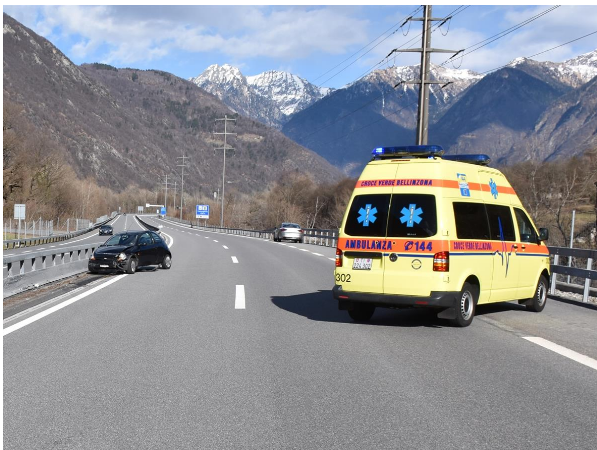
1500m vor Rastplatz Campagnola

Die 77-Jährige fuhr am Mittwoch alleine von Bellinzona kommend über die Autostrasse A13 in Richtung San Bernardino. Um 15 Uhr kollidierte sie Höhe Lumino aus noch nicht geklärten Gründen mit der rechtsseitigen Leitplanke. Anschliessend überquerte sie beide Fahrspuren und prallte heftig in die Mittelleitplanke. Total beschädigt kam das Fahrzeug auf der Überholspur zum Stillstand. Die Lenkerin erlitt leichte Verletzungen und wurde mit der Ambulanza Croce Verdi ins Spital nach Bellinzona überführt. Das auslaufende Motorenöl am verunfallten Auto wurde durch fünf Einsatzkräfte der Pompieri Bellinzona gebunden. Die deformierte Mittelleitplanke musste durch Mitarbeiter des Tiefbauamtes Tessin instand gestellt werden. Der Verkehr wurde während rund zweieinhalb Stunden einspurig am Unfallort vorbeigeführt. Die Kantonspolizei Graubünden klärt die genaue Unfallursache ab.