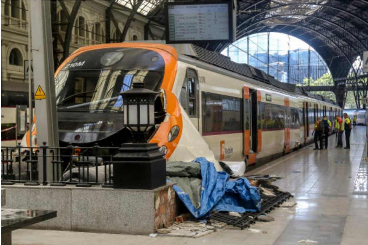
Eigene Messung am 29.12.2017: nun auf Höhe der Bahnangestellten auf obigem Foto: