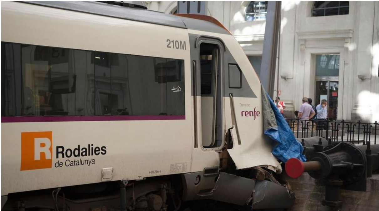
Als erstes wurden die Effekte der Kollision abgedeckt.