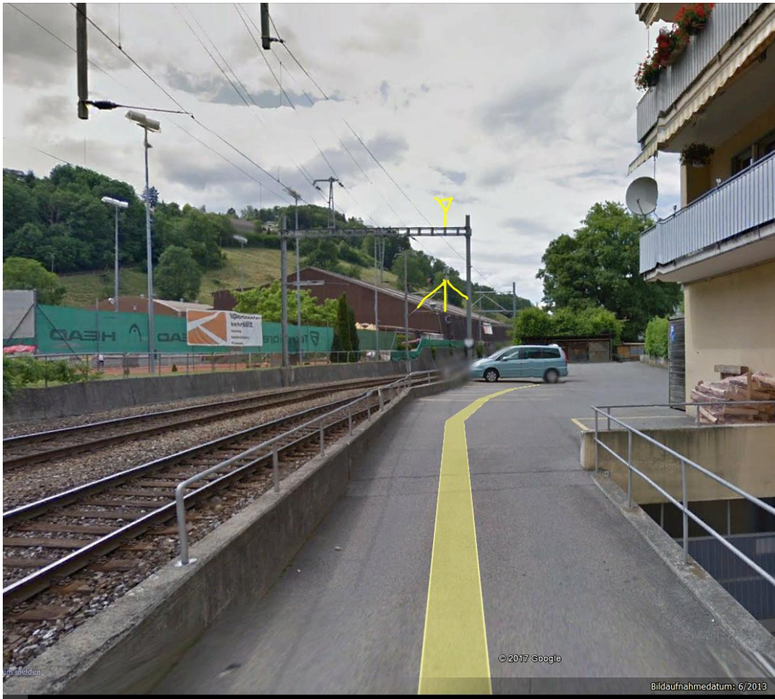
HS ebene 5 (SBB-Bahnstrom) quert 30m vorher