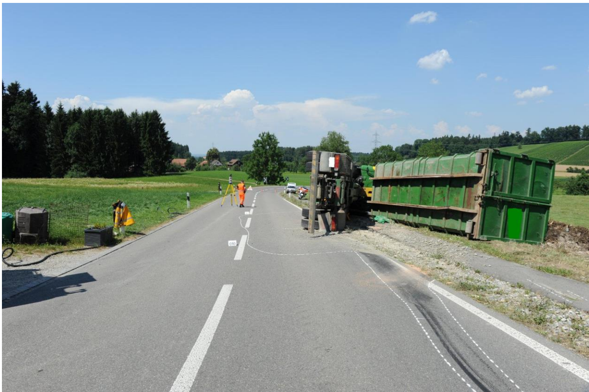
Holzschnitze. Hoher Schwerpunkt, rechtwinklige Kurve, bald Mittagessen....

http://www.kapo.zh.ch/internet/sicherheitsdirektion/kapo/de/aktuell/medienmitteilungen/2013_07/1307221d.html