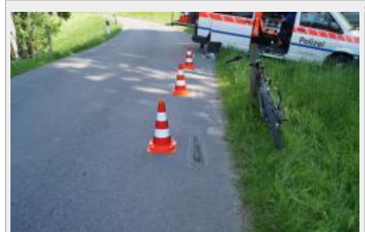
Baar ZG - E-Bikefahrerin schwer verletzt

Am Freitagnachmittag (24. Juni 2016), kurz vor 16:00 Uhr, fuhr eine 52-jährige Frau hinter einem Lieferwagen auf der Zugerbergstrasse talwärts. Auf der Höhe Neuhof in Allenwinden musste der Lieferwagen wegen eines entgegenkommenden Autos anhalten. Um mit diesem kreuzen zu können, fuhr der 81-jährige Lenker des Lieferwagens retour. Dabei erfasste er nach bisherigen Erkenntnissen die E-Bikefahrerin und überrollte sie. Die 52-Jährige wurde schwer verletzt und nach der Erstversorgung durch den Rettungsdienst Zug mit dem Rettungshelicopter ins Spital geflogen