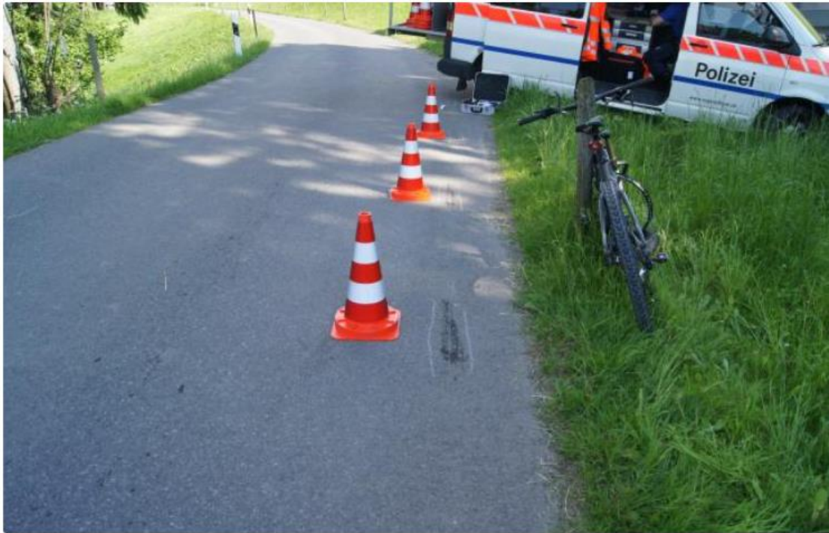
Baar ZG - E-Bikefahrerin schwer verletzt