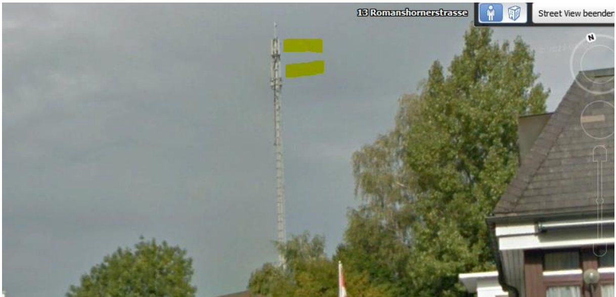
Der Sender Bischof Textil, Kappelhof wird abgeschirmt