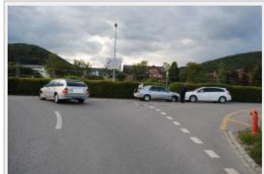
Beringen SH - Kollision zwischen drei Autos fordert zwei Verletzte

Verzweigung Grafensteinweg / Werkstrasse, ohne auf den zeitgleich von rechtsnahenden Personenwagen zu achten. In der Folge kam es zu einer Streifkollision zwischen den beiden Autos. Durch den Aufprall gelangte das Auto der 84-jährigen Frau auf die Gegenfahrbahn, wo es mit einem weiteren, korrekt entgegenfahrenden Personenwagen kollidierte.