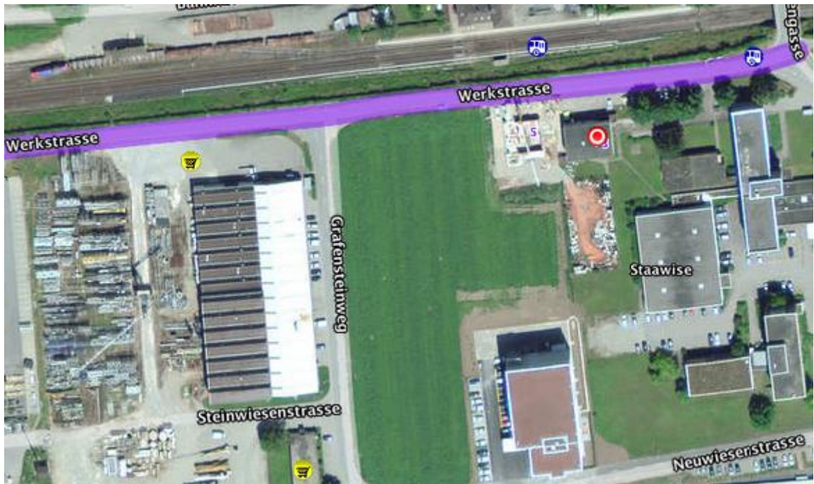
Distanz Fahrweg zu Antenne Süd: 130-170 m quer, Distanz zu Antenne Ost 300-130 m