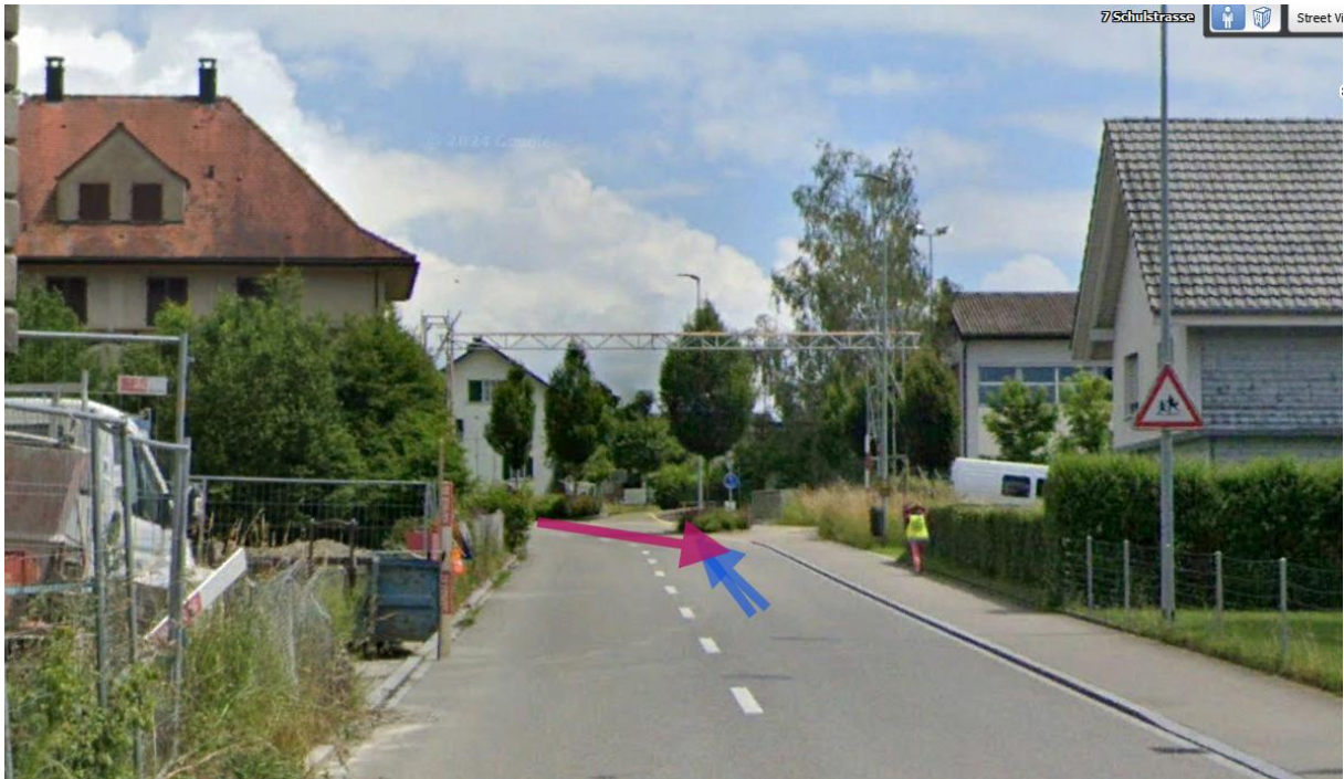
Schuleareal, street-view ist unterdrückt.