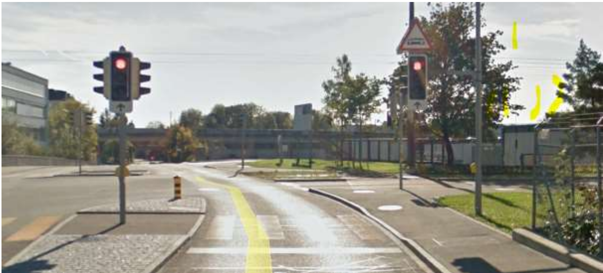
Direkte Sichtverbindung über niedriges Gebäude.