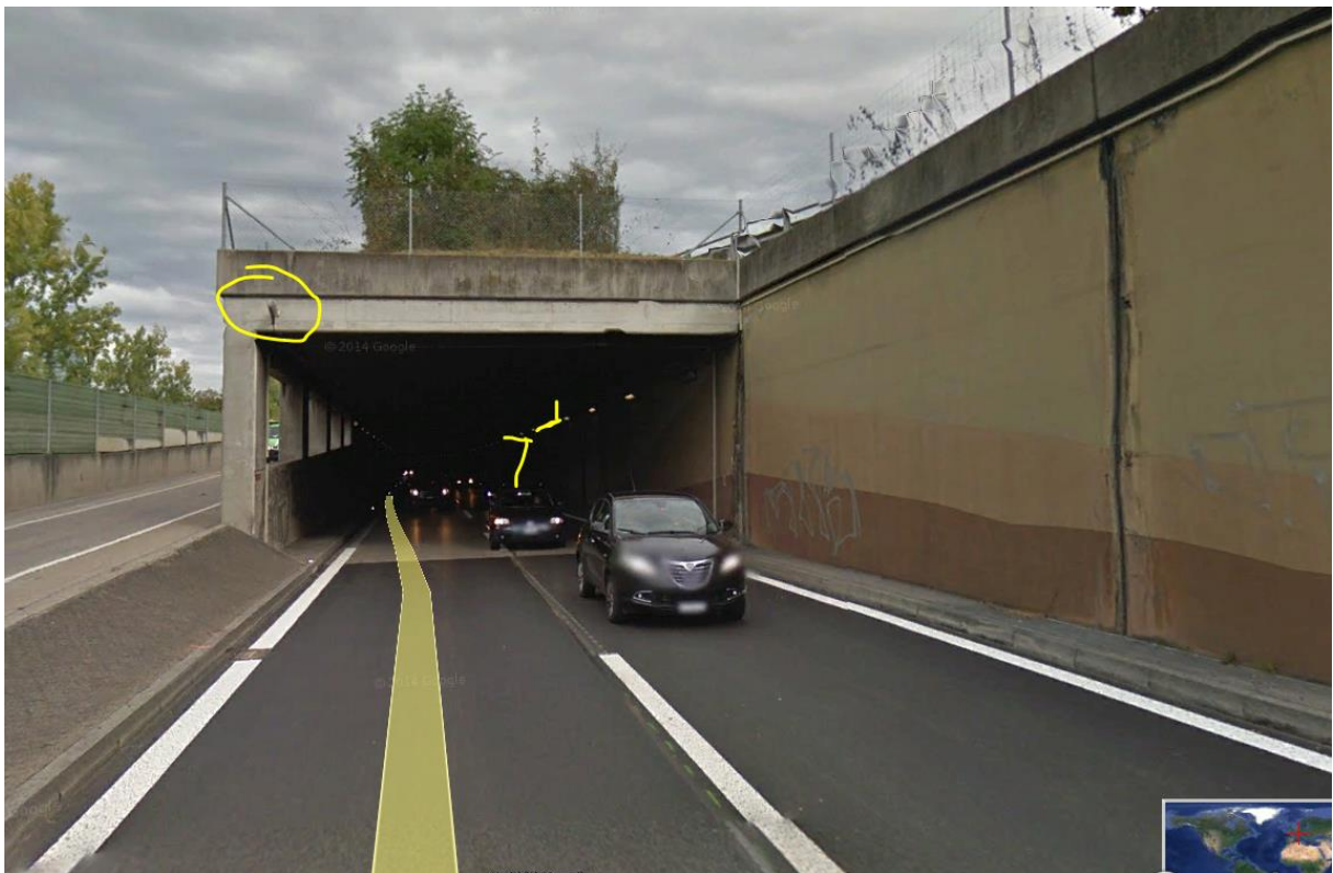
Portal Tunnelausgang FR Delsberg. Im Tunnel der oben gezeigte Sender