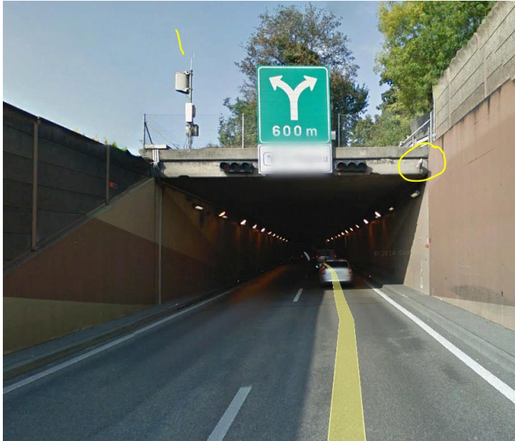
Situation auf der Nordrichtung, Portal ist etwa 50m weiter südlich angeordnet.