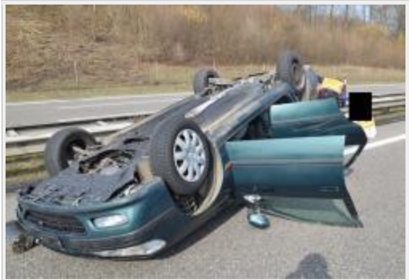
Arisdorf BL - Autobahn A2: Nach Kollision mit Lastwagen auf dem Dach gelandet: eine Person verletzt

Für die Dauer der Bergungs- und Aufräumarbeiten musste einer von zwei Fahrstreifen für rund 90 Minuten komplett gesperrt werden. Dies führte zu einem längeren Fahrzeugrückstau. Kurz nach 11.30 Uhr war die Unfallstelle komplett geräumt, danach normalisierte sich die Verkehrssituation zusehends wieder. Der stark beschädigte Personenwagen musste abgeschleppt werden.