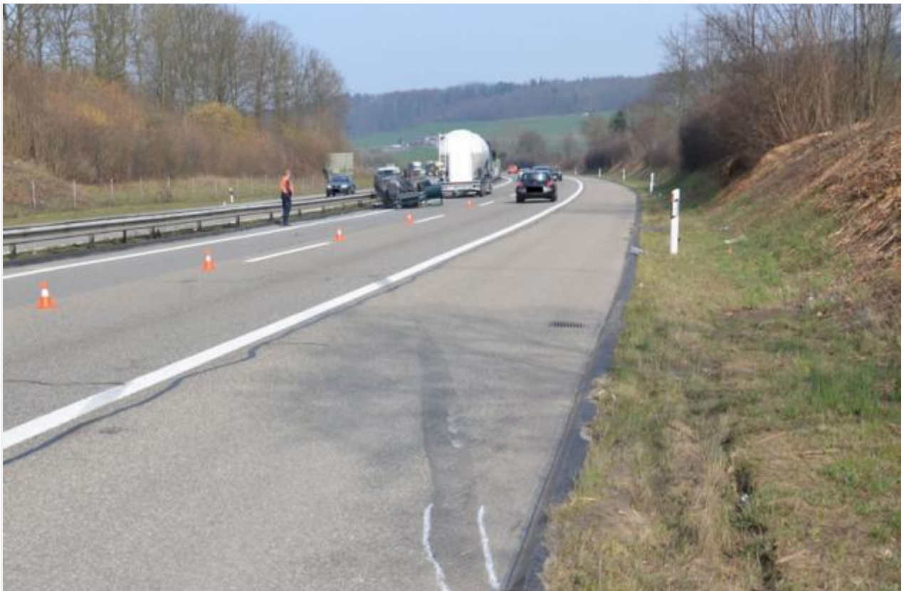
Arisdorf BL - Autobahn A2: Nach Kollision mit Lastwagen auf dem Dach gelandet: eine Person verletzt

Antenne Hopfernholz 1.5 km UMTS gross, gsm mittel, lte mittel Antenne Arisdorf ost gsm, umts sehr klein