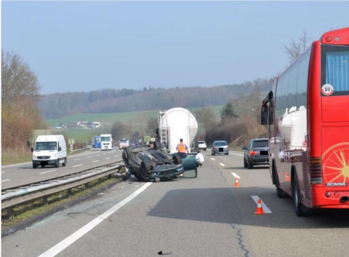
Arisdorf BL - Autobahn A2: Nach Kollision mit Lastwagen auf dem Dach gelandet: eine Person verletzt