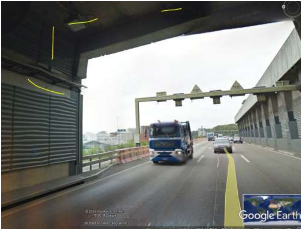
Senderlage auf Spur nach Norden: hier deutlich erkennbar: innerhalb des Tunnels