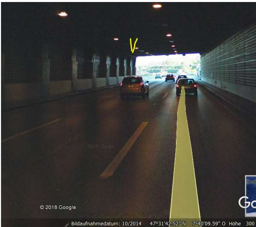
vermutlich auch hier auf Südspur am Ausgang, also 261 m, beidseitig sendend