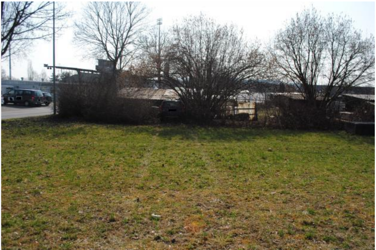
Schaffhausen SH - Autofahrer verliert Kontrolle über sein Fahrzeug

Warum es genau zur Kollision kam, wird von der Schaffhauser Polizei untersucht.