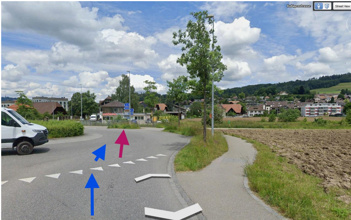
90°-(maximal) exponiert zum adaptiven Sender auf der Trimsteinstrasse 18