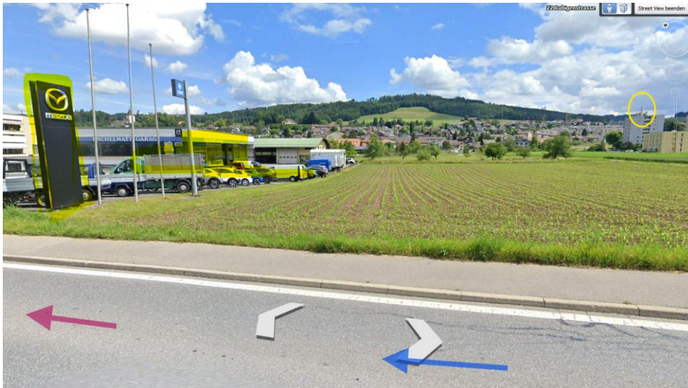
Vorbeifahrt mit Reflexionen an Tankstellen (-Schildern), Fahrzeugen: