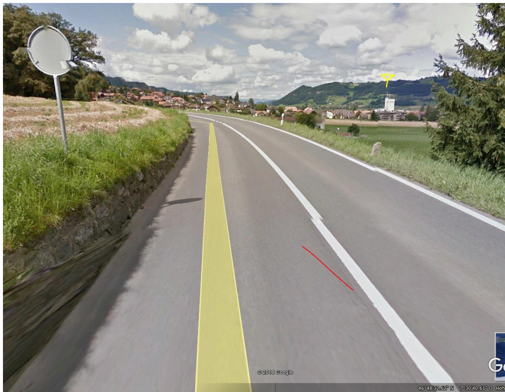
Fährt aus Gebäude und Tannenschatten ins Feld.