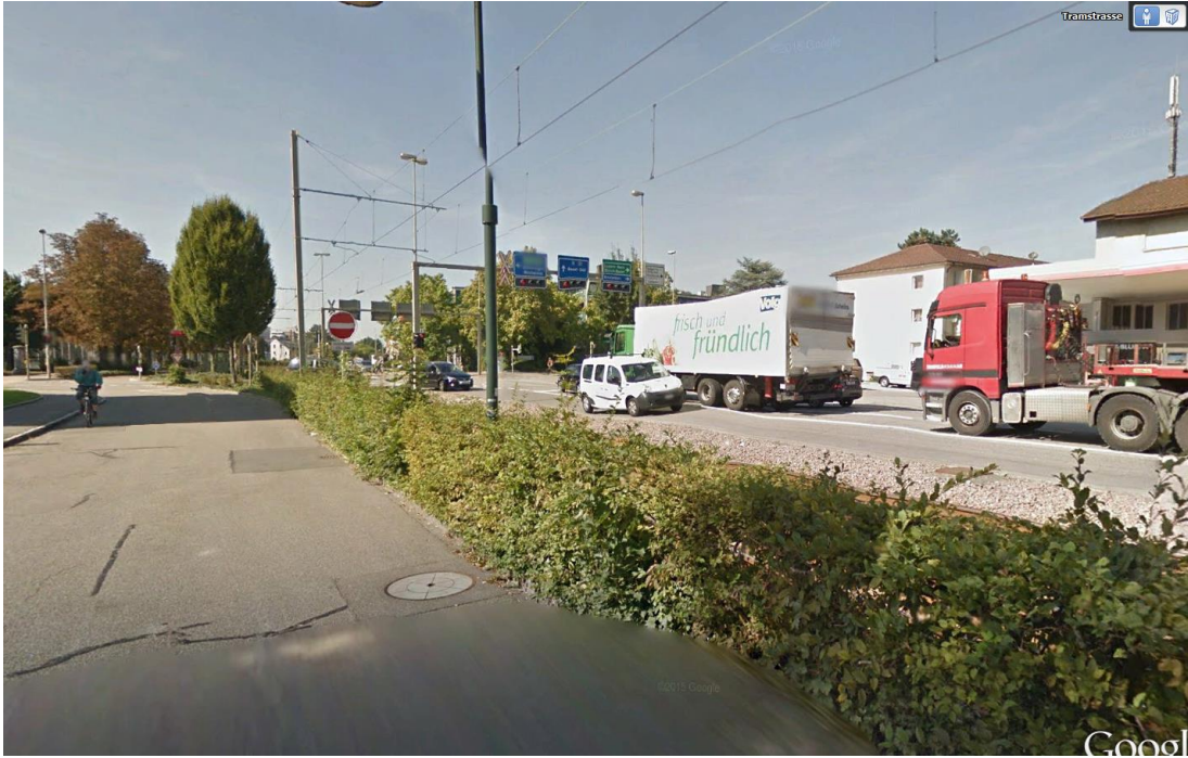
Nicht vermerkter Sender, ev Polycom auf dem Dach Avia Tankstelle: