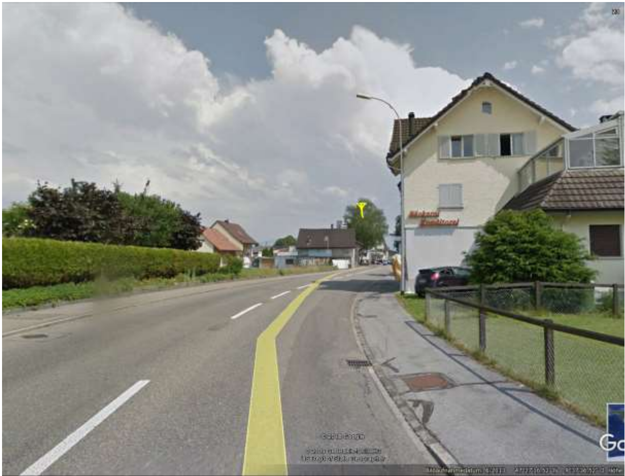
Laubbaum, im Februar keine / nur schwache Dämpfung