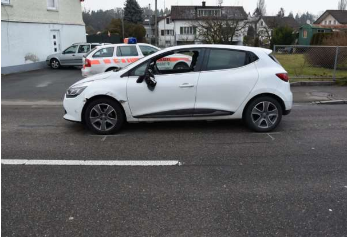
Auto der entgegenkommenden Frau, leichte Streifspuren am vorderen Kotflügel