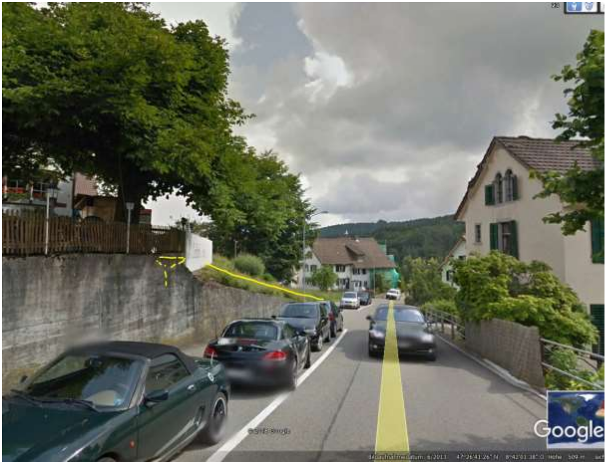
Hier biegt er nach links ab (zum google-Signet)