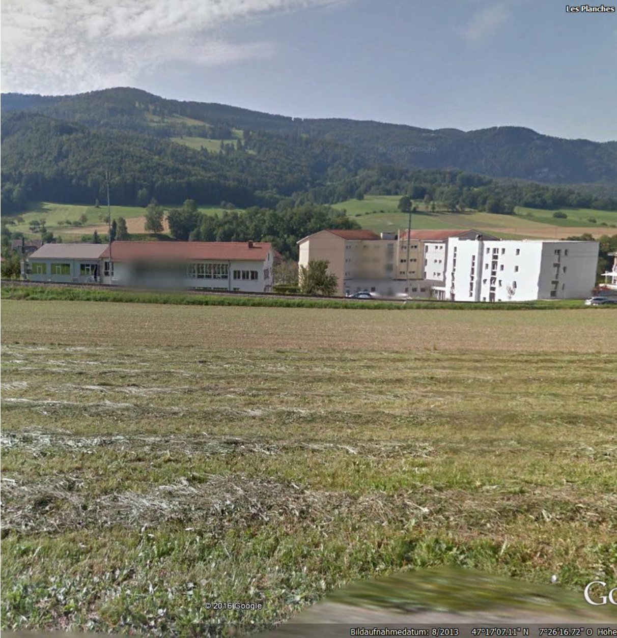
Auf Strafanstalt o.ä. polycom