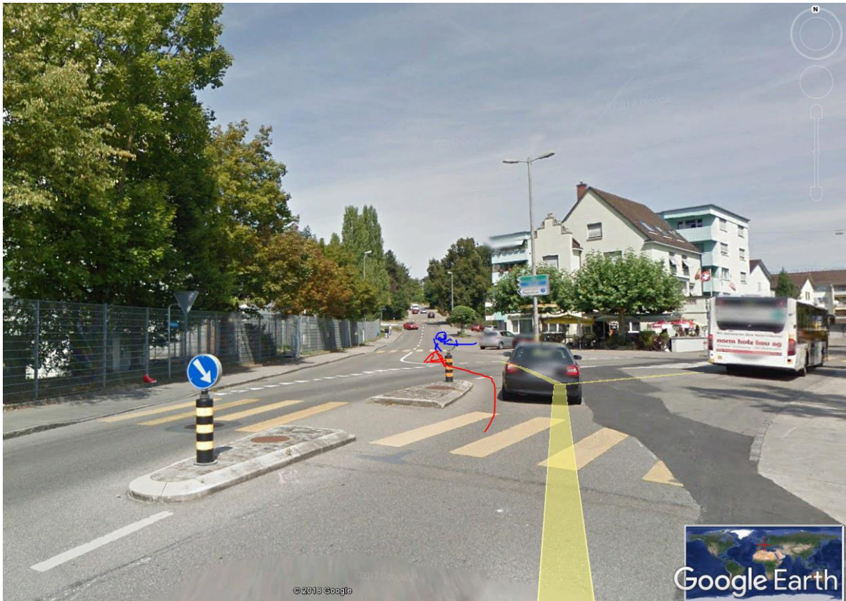
Kein funk, Situation an Kreuzung auch herausfordernd bzgl Gegenverkehr-Querung.,Siehe Unfalldaten