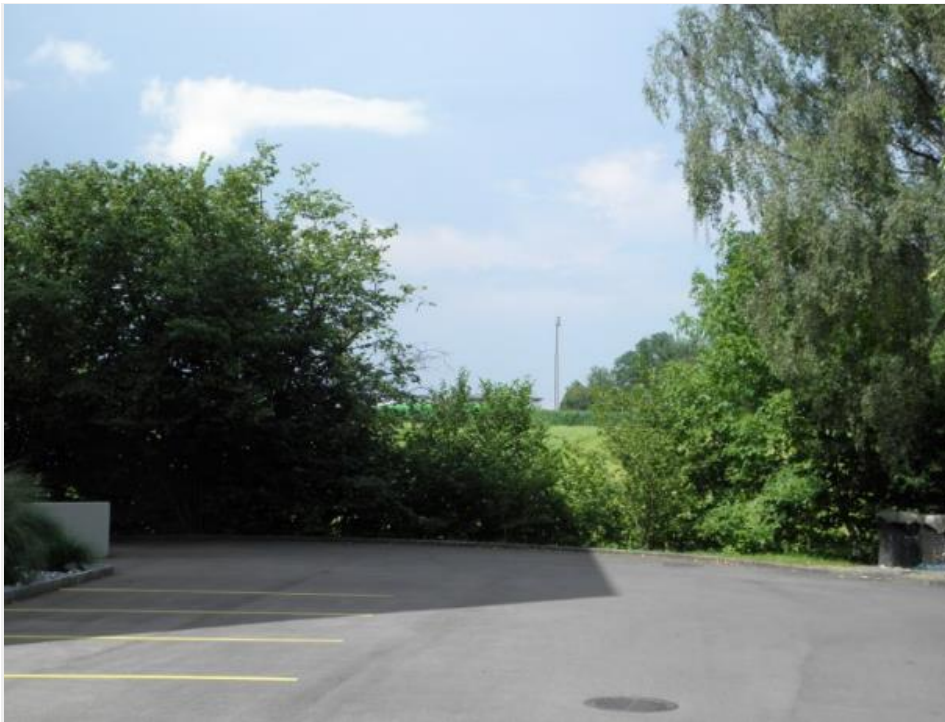
Parkplatz nach Haus 13 und vor Haus 15, Sicht Sender frei.