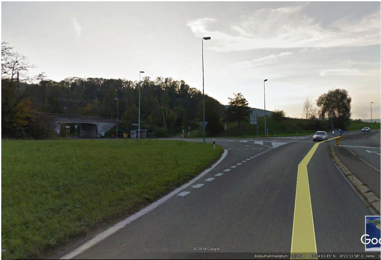
Einmünder verläuft in OnO-Richtung. Sender 1 frontal.