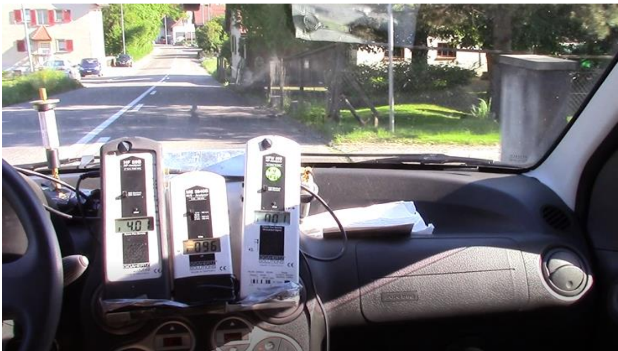
Zweite Durchfahrt (peak verzögert ca.0.5 sek. dargestellt)