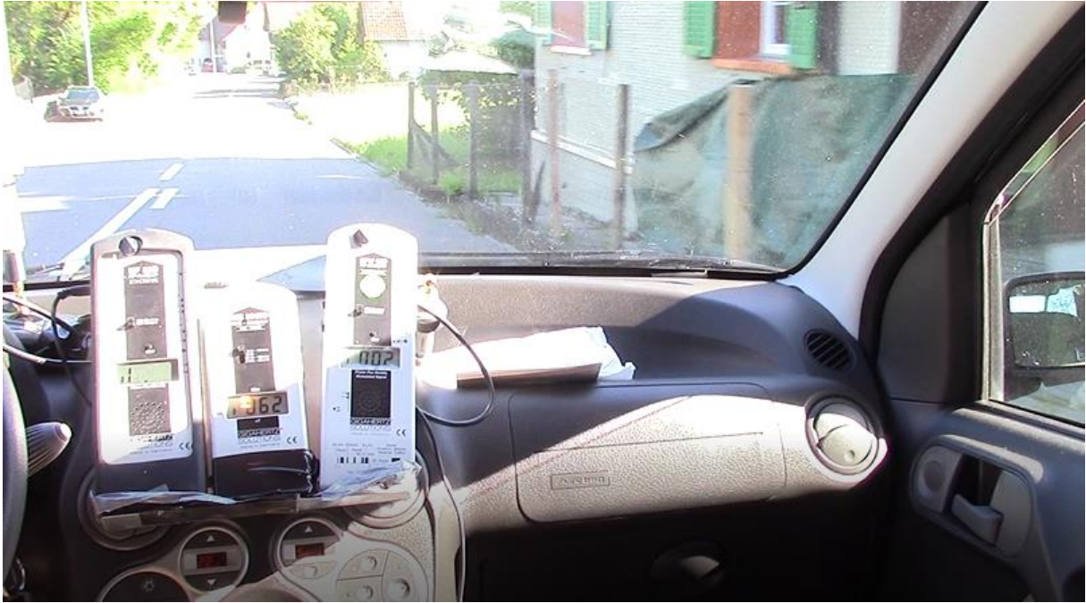
Vierte Durchfahrt 18.77 uW, oberhalb