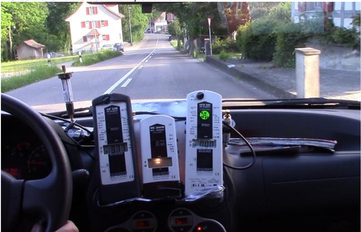
Zehn Meter später overflow