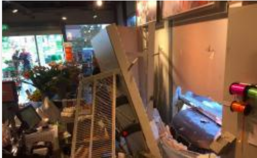
Muttenz BL - Rentner landet mit Auto in Laden

Am Donnerstag, 18. August 2016, kurz vor 09.45 Uhr, kam es bei einem Verkaufsgeschäft an der St. Jakobs-Strasse in Muttenz BL beim Einparken zu einem Selbstunfall mit einem Personenwagen. Personen wurden keine verletzt.