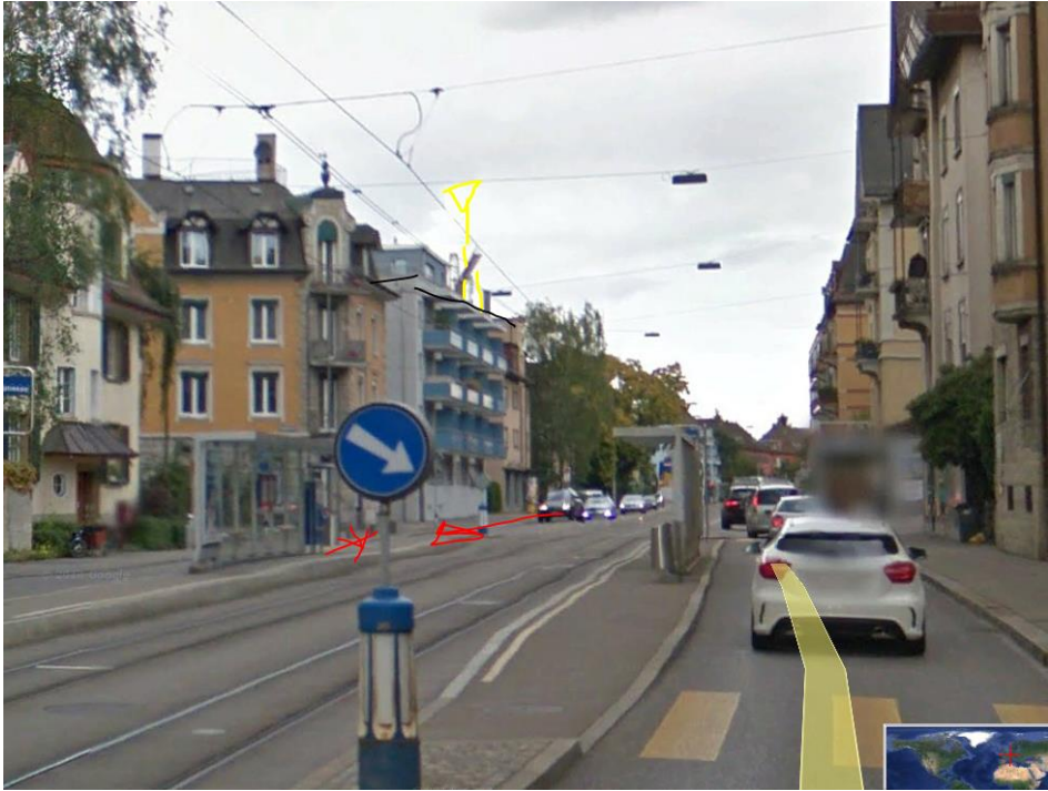
Dieser Sender verliert auf der Ostspur knapp vor der Unfallstelle die direkte Wirkung, ausser Reflexionen an der Häuserzeile, Über Karosserieform des Fahrzeugs ist nichts bekannt.