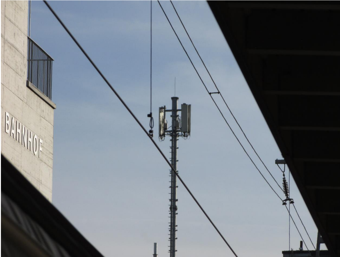
Der wirksame Sender an der Stelle des Sturzes