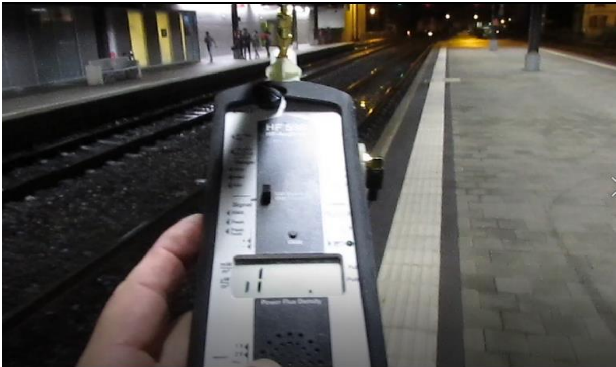
Frauenfeld Perron 2 R W