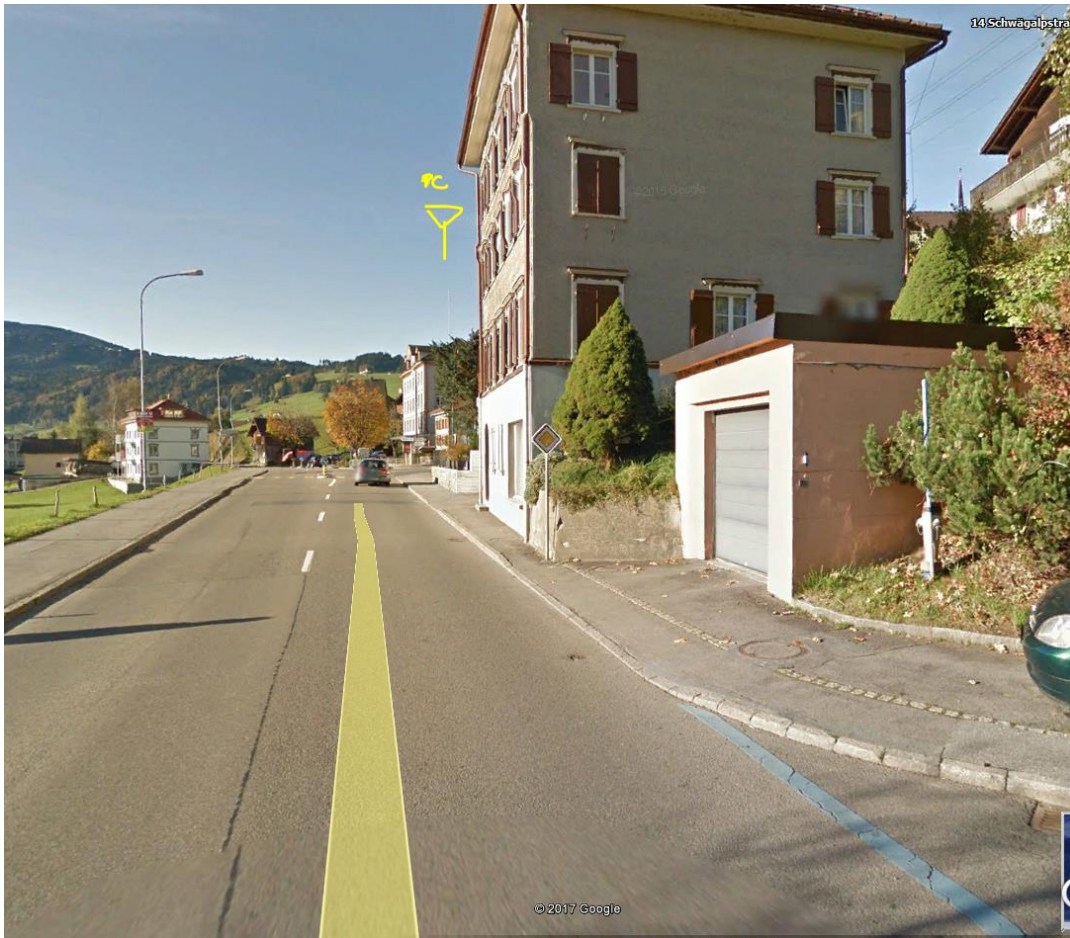
Sicht auf Polycom Sender auf Depot am Dorfausgang. Hier links die Messung, zu Fuss.