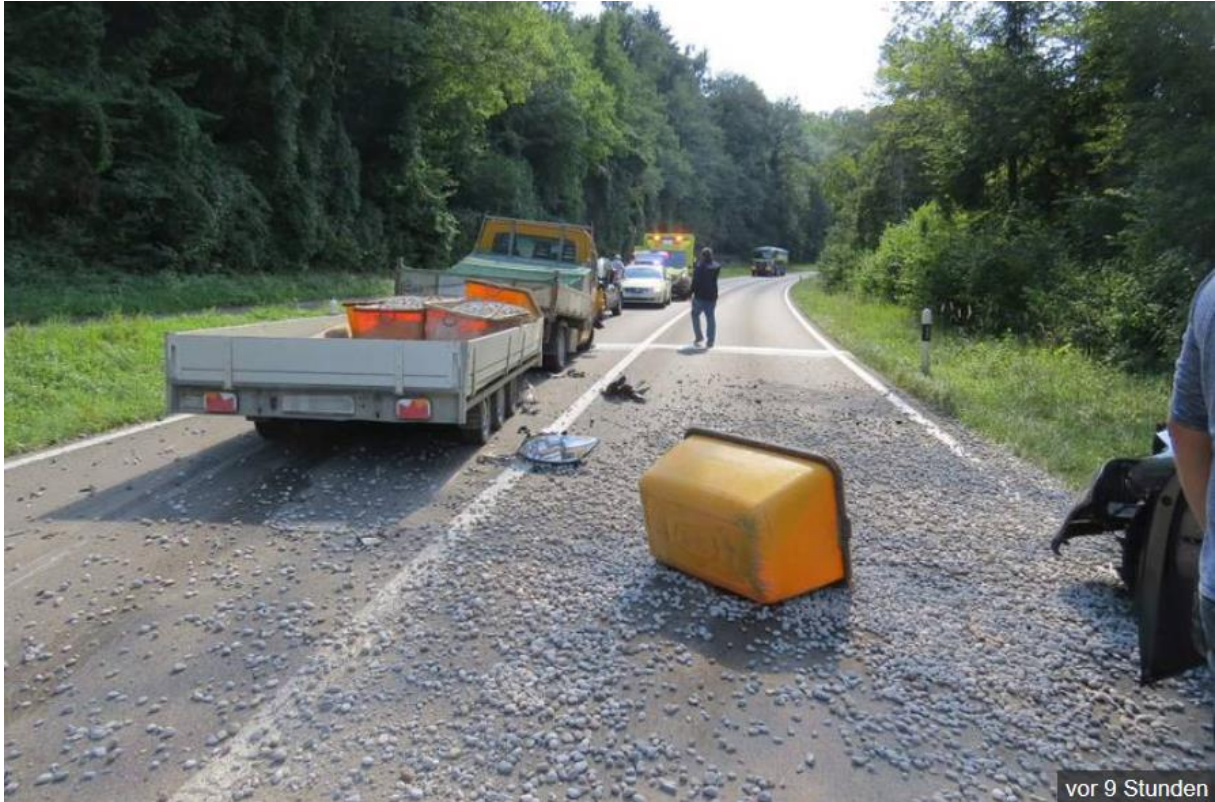
vor 9 Stunden