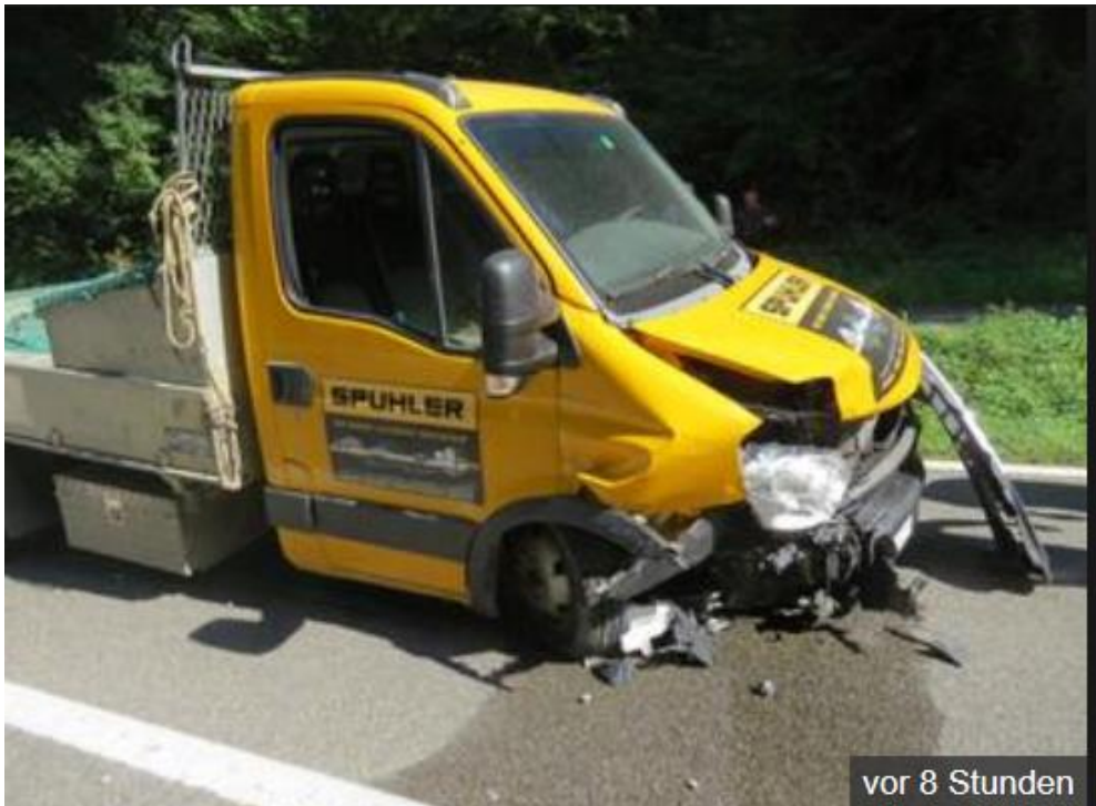
vor 8 Stunden