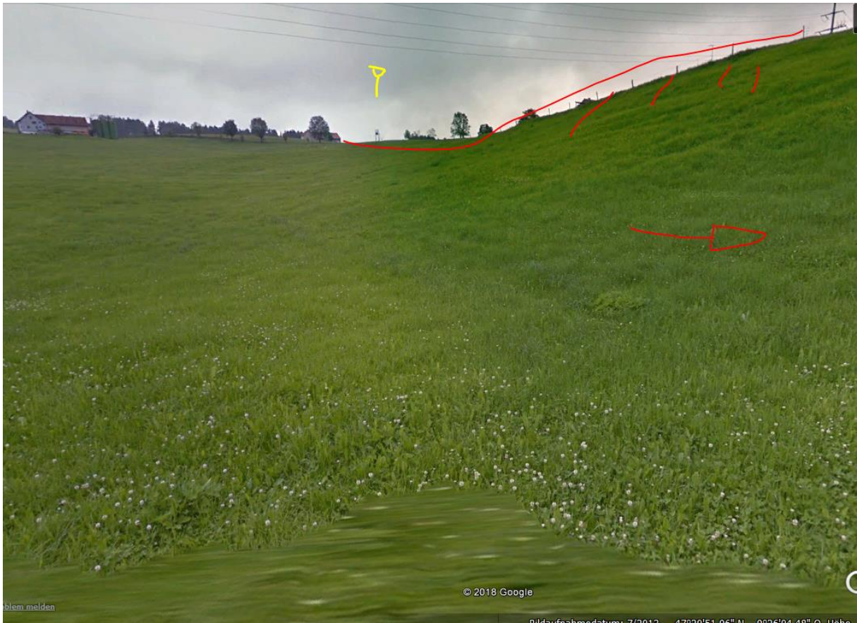
Sender Hirschberg vermutlich von Hügel verdeckt, ausser P-Anfahrt.