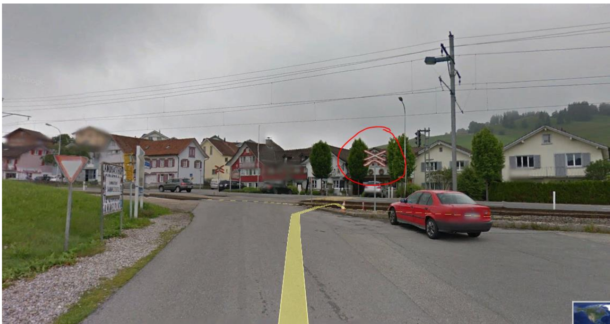
2013 keine Warnblinkanlage