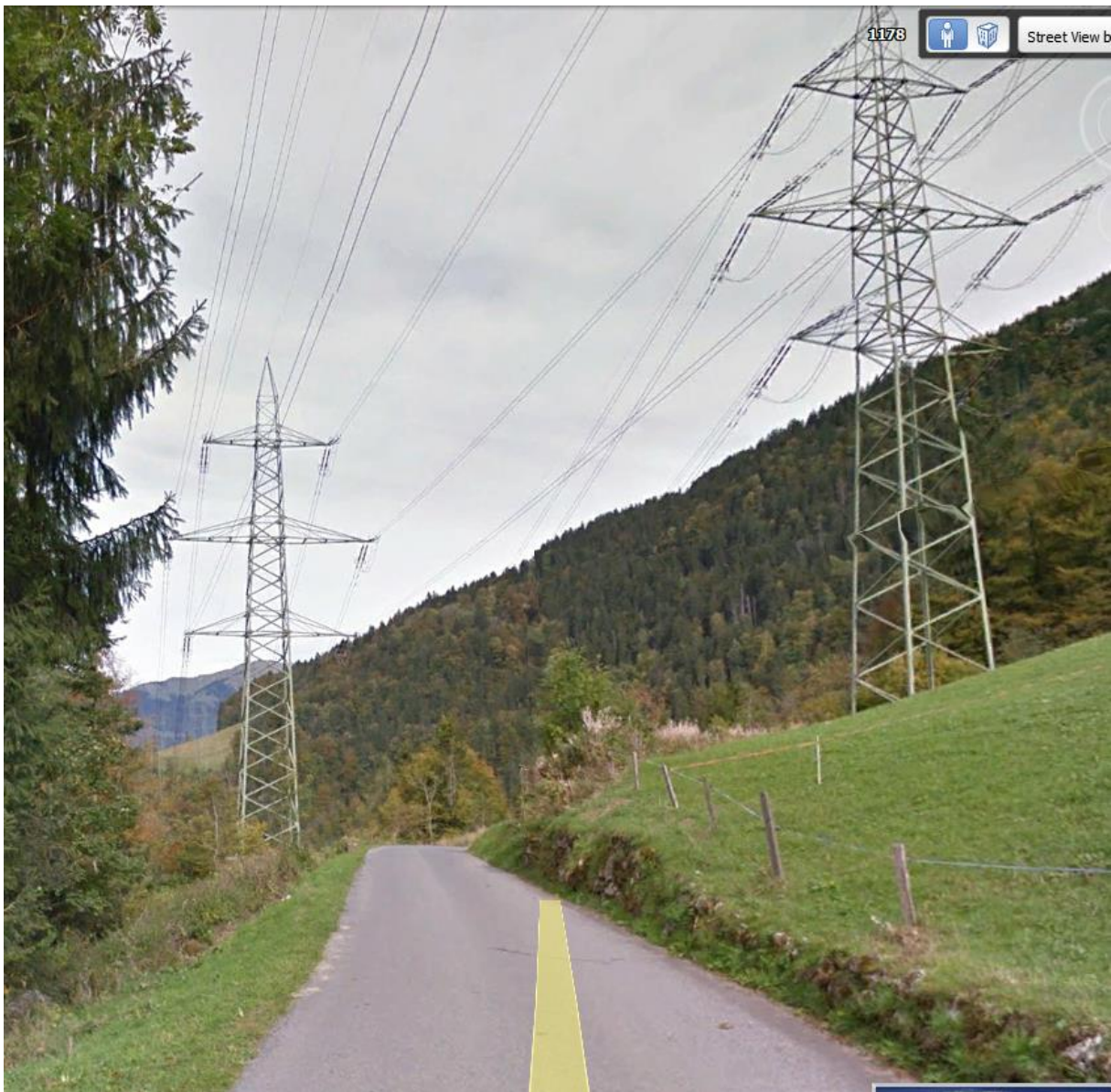
Steer-view inaktiv, hier zwei der Trassen etwa 2 km südlich.